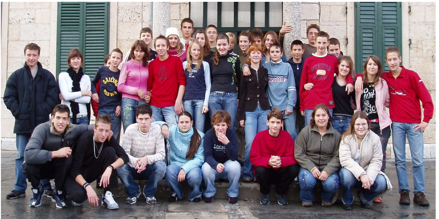
Učenici VIII. a i b razreda, školske godine 2005/06.